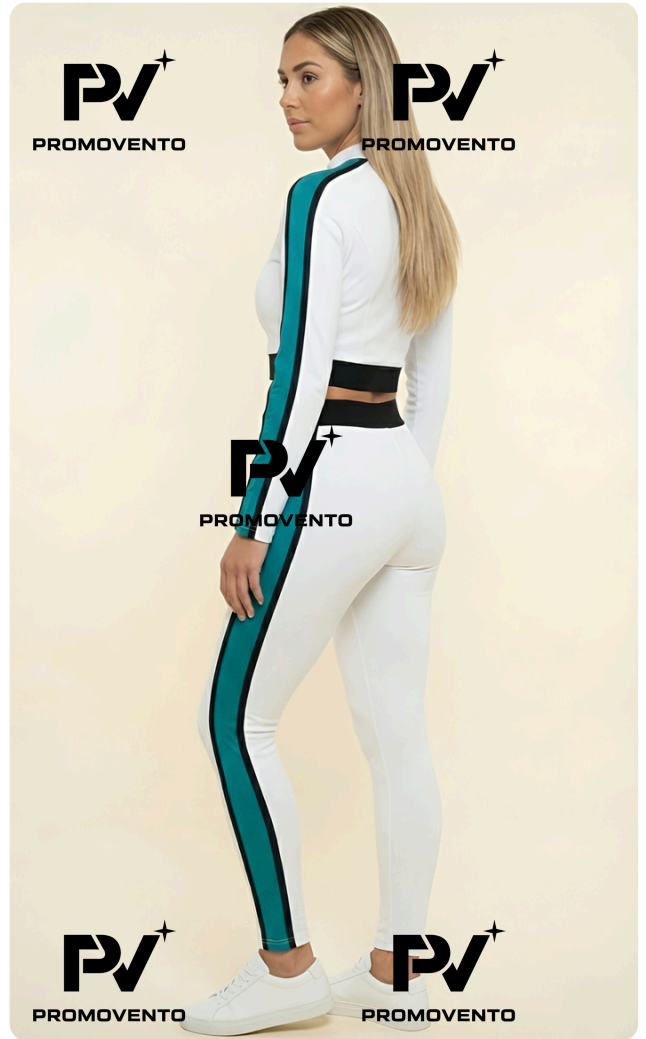
Proyección de Imagen Armonía · Luminosidad · Estilo