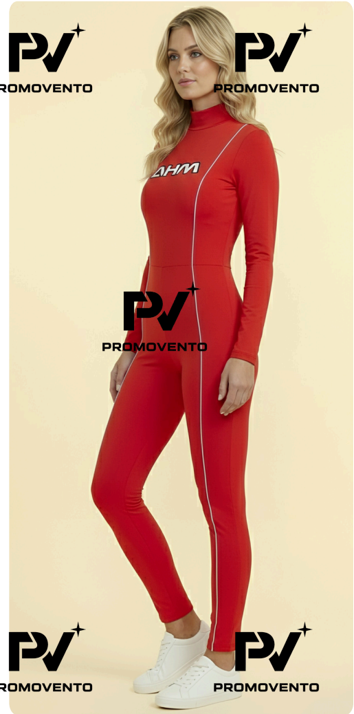
Proyección de Imagen Elegancia · Estatura · Fluidiez